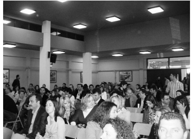
Άποψη από το ακροατήριο στη Συνεδρία για το Ασφαλές Διαδίκτυο.